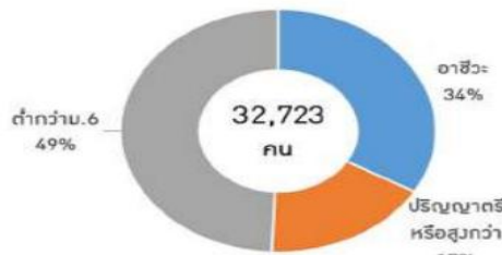
ภาพที่ 1 โครงสร้างกำลังคนของอุตสาหกรรมเป้าหมายและอื่นๆ ใน EEC ในปี 2560